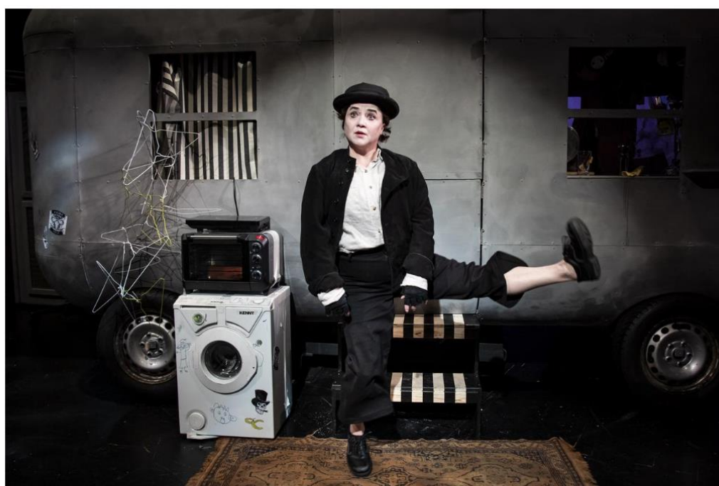
”Buster Keaton på månen” är ett nära samarbete mellan Suzanne Osten och Gunilla Linn Persson.

Om det inte vore för hur verkligheten ser ut, speglad i scenkonstplattformen Assitejs rapport som visar att så många som en tredjedel av landets kommuner inte kan garantera att barn får se enda föreställning under sin skoltid. Namnet på rapporten är ”Spelar mindre roll?” och jag tänker att frågan syftar på både barnen som förfördelas – och den bortprioriterade scenkonsten.